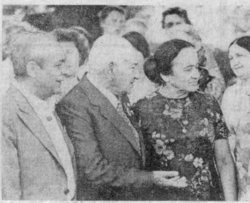
Унутилмас учрашувлар — шонра Зулфия озарбайжонлик ҳаммаслари Ийрон Қосулов, Сулаймон Рустам ва Марварид Дильбоз даврасида: Озарбайжон ССР Давлат рақс ансамбли ўзбекча рақс имро этмоқда.