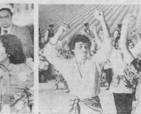
Унутилмас учрашувлар — шонра Зулфия озарбайжонлик ҳаммаслари Ийрон Қосулов, Сулаймон Рустам ва Марварид Дильбоз даврасида: Озарбайжон ССР Давлат рақс ансамбли ўзбекча рақс имро этмоқда.