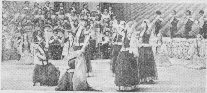
СУРАТДА: Озарбайжон ССР Давлат рақс ансамблининг чиқиши.