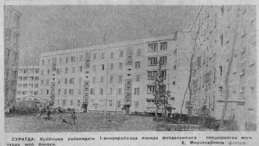
СУРАТДА: Нуйбешев районидagi 1-микрорайонда яқинда фойдаланишга топширилган янги турар жой биноси.

Озарбайжон ва Ўзбекистон халқларининг яқин қардошлигини улуғловчи қатор саҳифалар бор. Республикамизда жуда катта муваффақият билан ўтган бизнинг адабиётимиз ва санъатимиз байрами ана шу саҳифаларнинг энг ёркини бўлиб қолади. Мен санъаткор сифатида, ўзбек халқининг энг яқин дўсти сифатида сизнинг ўлганинга 1939 йилдан буюн аярат қилиб келаман. Бу ерда жуда кўп қувончли ва маданий воқеаларнинг гувоҳи бўлганман. Ўзбек халқи социализм йилларида муҳим маданиятини ривожлантириш борасида жуда катта ютуқларни қўлга киритган. Ёзувчиларда «Адабиётлар дўстлиги» халқлар дўстлиги» деган гап бор. Бундан келиб чиқиб музикалар дўстлиги—халқлар дўстлиги дейиш мумкин. Ёзувчиларимиз бир-бирларининг асарларини таржима воситаси билан тунушсалар, бизнинг музика асарларимизни билиш учун ҳеч қандай таржимани ҳожат йўқ. Озарбай-