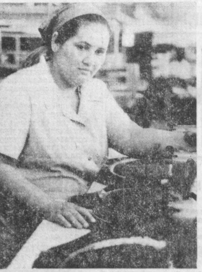
Шаҳримиздаги бадий буюмлар фабрикасининг аҳли...