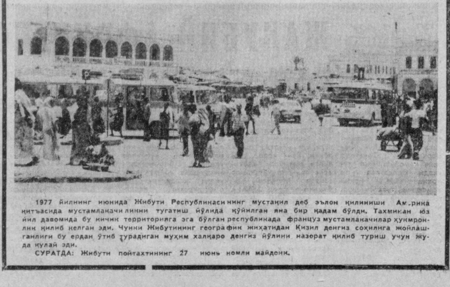
1977 йилнинг июнида Жибут Республикасининг мустамил деб эълон қилиниши...