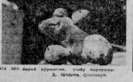
Айрим сабаблардан ўз шани-шайолини билан турли маъжудларни эслатади. Ҳаёлингизга эрк бериб кўринг-чи, ушбу нарсага