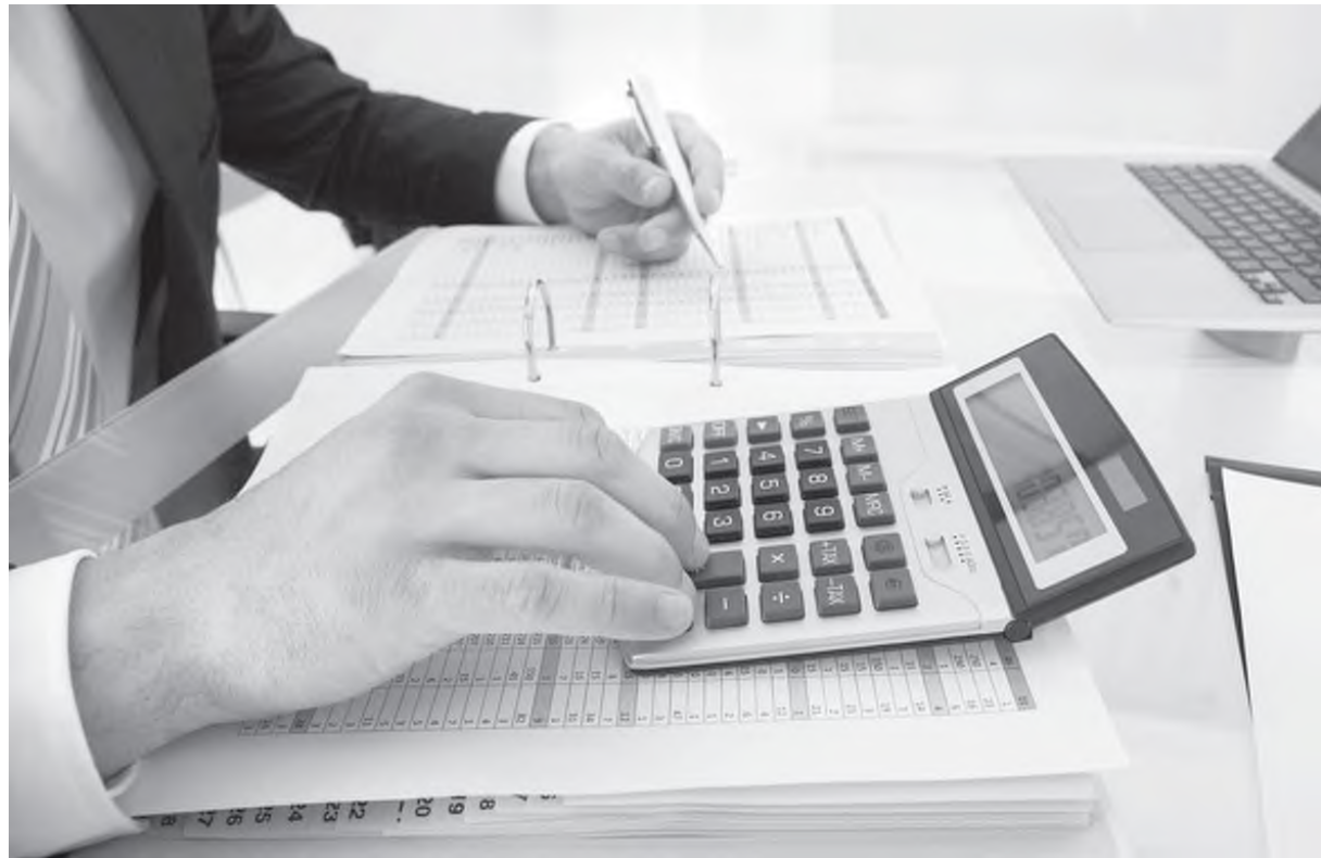
у иқтисодиётни янада ривожлантиришига ҳисса қўшади