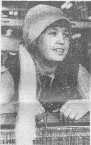
Пойтахтимиздаги Анвал Иромова районда...