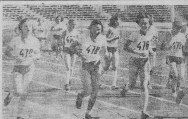
Яқинда бўлган республика ўқувчиларининг спартакиадасида Тошкент шаҳри терма командаси муваффақияти қатнашди. СУРАТДА: енгил атлетика бўйича шаҳар терма командаси аъзолари стартада.

Ўзбекистон миллий кураш федерациясининг раиси, Ўзбекистон ССР Давлат спорт комитети миллий кураш бўйича бош тренери.