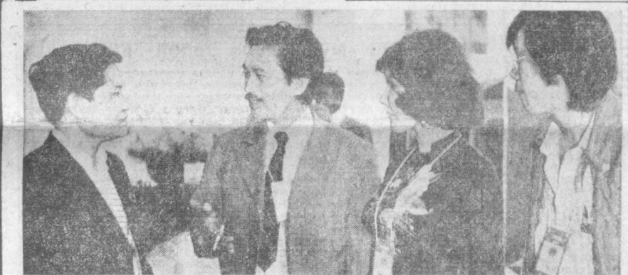
Осиё, Африка ва Латин Америка мамлакатлари Халқро Тошкент кинофестивалида Вьетнам Социалистик Республикаси кинематографчиларининг картиналари катта муваффақият билан намойиш этилмоқда. СУРАТДА: Вьетнам Социалистик Республикасида келган кинოსанъаткорлар Тошкент киноанжуманидан олган таассуротларни ўртоқлашишмоқда.