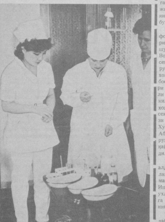
СУРАТЛАРДА: шифохонада ёшларни касбга йўналтириш бўйича ўтказилган кўриқдан айрим лавҳалар.