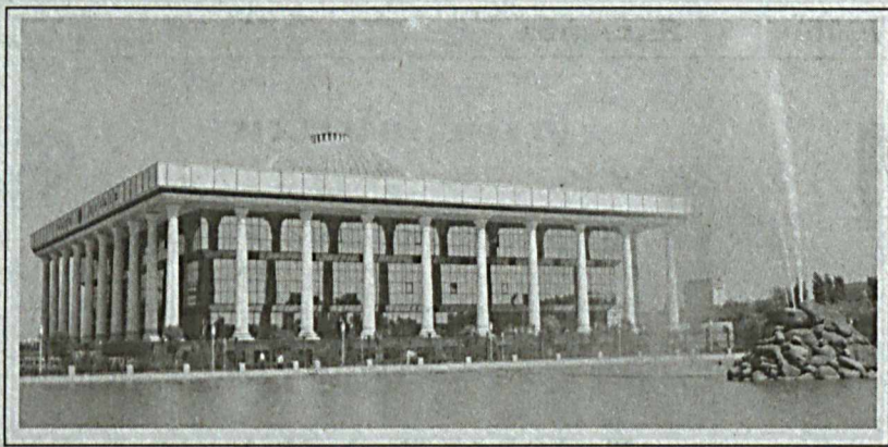
(Давоми. Бошланғичи 1-бетда).

Таъкидланганидек, шу пайтгача Ўзбекистон Республикаси томонидан Инсон ҳуқуқлари бўйича БМТ Кенгашига икки марта ба Миллий даврий маърузалар тақдим қилинган бўлиб, уларда давлатимиз қўшилган инсон ҳуқуқлари соҳасидаги 70 дан ортиқ халқаро ҳужжатларнинг юртимизда қандай ижро этилаётгани хусусида батафсил маълумот берилган. Мамлакатимизнинг навбатдаги Учинчи Миллий даврий маърузаси Кенгашнинг жорий йил апрель-май ойларида ўтказилиши режалаштирилган. 30-сессиясида кўриб чиқилади. У аввалиги маърузалар юзасидан БМТнинг шартномавий органлари ҳамда Инсон ҳуқуқлари бўйича Кенгаш томонидан билдирилган тақлифлар асосида ишлаб чиқилиб, 60 дан ортиқ давлат идоралари ва фуқаролик жамияти институтлари вакиллари, БМТнинг Инсон ҳуқуқлари бўйича Олий Беш Комиссариати ҳамда БМТнинг Ўзбекистондаги иختисослаштирилган агентликлари экспертлари кўмаги ва иштирокида тайёрланган.