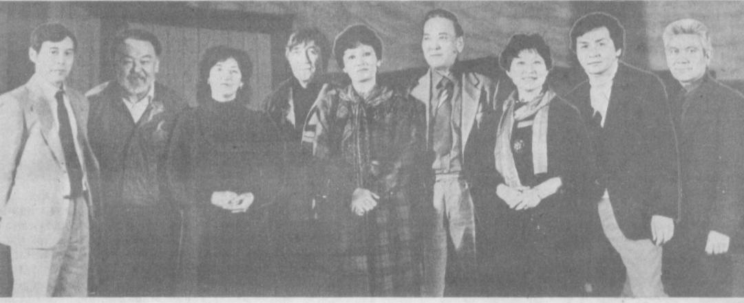
Суратда: қозғистонлик санъаткорлар.