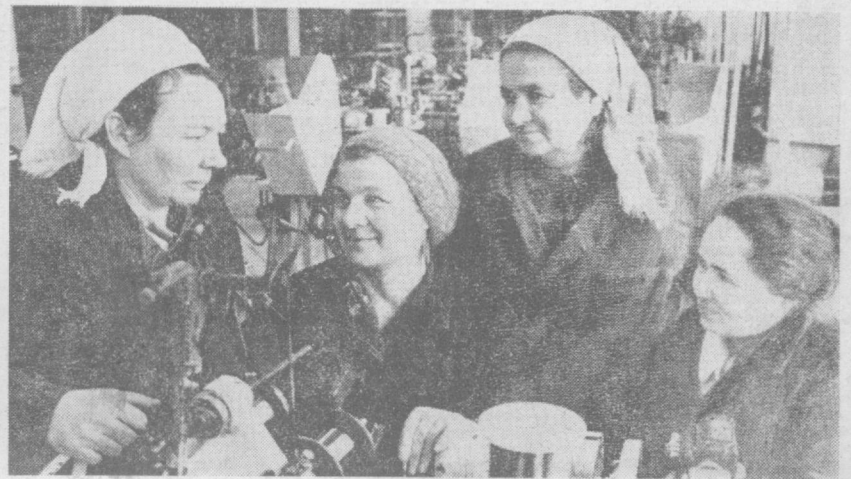
Тошкент элентр машинасозлиги заводи коллективи мамлакатимиз энергетика саноати тармоқлари учун кўпга турли хил маҳсулот тайёрлаб юрмоқда.

Ободлаштириш ва кўламзорлаш тирли бўйича программamız биринчи ҳизматчиларимиз 300 квадрат метр жойни тозалаш, 310 туп дархат, бутта ва гул қўчалари ўтказилади.