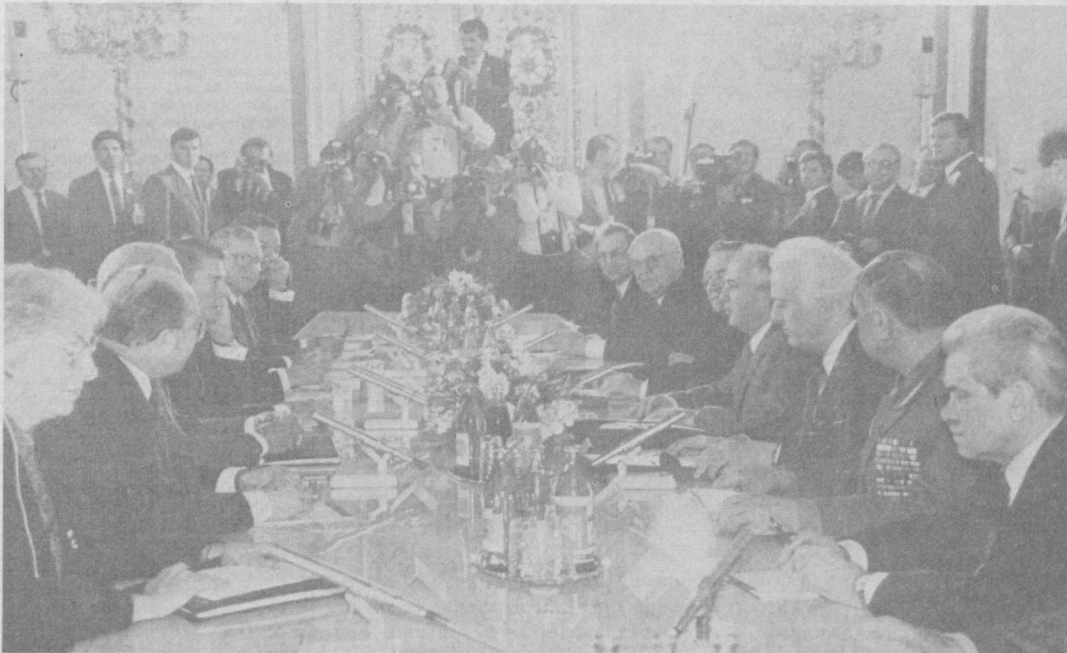
30 май. Москва. Совет-Америка музокаралари пайтида.

Совет томонидан М. С. Горбачев рафиқаси билан, А. А. Громико рафиқаси билан, Н. И. Рижков рафиқаси билан, В. И. Воронников, Л. Н. Зайков, Е. К. Лигачев, В. П. Никонов, Н. Н. Слюнков, М. С. Соломенцев, В. М. Чебриков, Э. А. Шеварднадзе, А. Н. Яковлев, П. Н. Демичев, В. Р. Долгих, Ю. Д. Маслюков, Г. П. Разумовский, Н. В. Талезин, Д. Т. Язов, О. Д. Бакланов, А. П. Бирюкова, А. Ф. Добринин, А. И. Лукьянов, В. А. Медведев, И. В. Калинин, СССР Олий Совети Президуми ва Министрлар Совети раисларининг ўринбосари, бир қанча министрликлар ва идораларнинг раҳбарлари, ҳарбий бошлиқлар, таниқли фан, маданият ва санъат арбоблари, руҳонийлар бор эдилар.