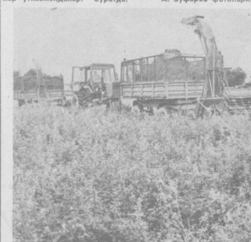
ЯГОНА ПЛАН БЎЙИЧА

Шартномалар бўйича вақтида махсусот юбориб турмаслик сабабларини аниқлаш мақсади билан район, шаҳар координация советларида танишиб чиқиш учун уларга йўлланма бериш хужжатини ўрнатилди даркор. Бундай усул Олмалик, Чирчиқ шаҳарлари, Ўрта-Юқори районда қўлланилмоқда. Масалан, шу йил апрель ойида республика Молия министрлиги вакиллари Олмалик маъбелъ фабрикасини текширишга келишди. Олмалик шаҳар координация совети қайта текширишга рўхсат бермади. Албатта, бундай қилиш мумкин. Лекин район, шаҳар, область координация советларида комплекс текширув натижалари бадастур бўлса,