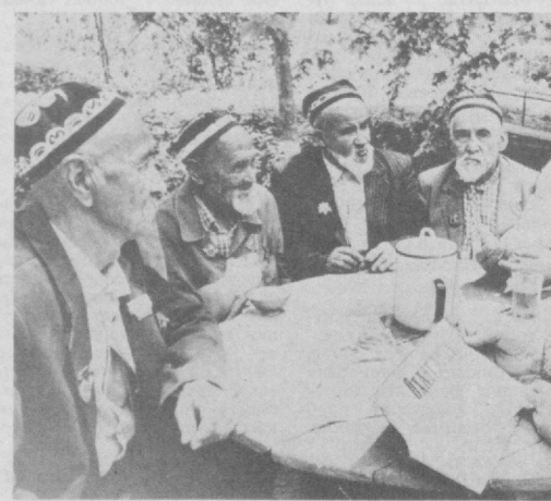
ОҲАНГАРОН. Қорахитой қишлоғи марказидаги чохона доим отахонлар билан гавжум бўлади. Улар орасида меҳнат ва партия ветеранлари, суяги меҳнатда қотган кекса пахтакорлар бор. Ветеранлар оқшом пайтлари бер ерда йиғилишиб, ўзаро суҳбат қўришяпти. Улар КПСС Марказий Комитетининг XIX Бутуниттифоқ партия конференция-

Очигини айтганда авваллари газета-журналларни ҳафса-сизлик билан ўқирдим. Ахир, турган битгани мактовлардан иборат мақолалар, баландпарвоз даъватлар, номи бору, самараси йўқ ютуқларнинг тарғиб қилиниши меъдага тегадиди. Аммо, кейинги уч йил ичиде матбуот нашрларининг фаолияти тубдан ўзгарди. Қизик-қизик материаллар кўпая бошлади. Энг асосийси босиб ўтган йўлимизга, бугунги ҳаётимизга таъкидий назар билан қаралиб, оқини-оқ қорани — қора дейишга бошланди. Айниқса, ўтмишда партия ва ҳукуматимиз раҳбарлари бўлган тарихий шахслар ҳақида бор ҳақиқатни рўй-рост айтилаётгани менга кўпроқ манзур бўляпти. КПСС Марказий Комитети Тезисларида шундай жумла: