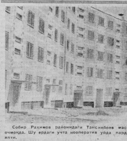
Собир Раҳимов райондаги Тансиқовов массивни кўн сайин чирок омонда. Шу ердаги учта кооператив уйда пардозлаш ишлари тугалланди.

Тошкентдаги 1-автомобил ремонт заводида автомобил линия жўриқ этилди. Шу линия тўғрисида мотор цилларларини йўлиш мажарани тўрт барабар тезлаштириди. Ремонт заводлари бирлашмасининг хўжалик хисобидидаги конструкторлик бюроси асган автоматизинг атиги бир ишчи бошқарилади. Линия ишга туширилгунга қадар йўлиш станцияларида 10 кишидан иборат бригада самда эди. (ЎЗТАГ).