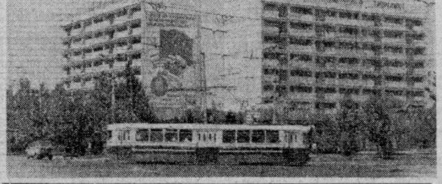
«Москва» меҳмонхонаси, янгигина қурилган.

ОСМОНЎПАР БИНОЛАР «Шаҳарда кўп қаватли уйлар йўқ. Икки қаватли уйлар эса йигирмата да и оймайди. Бундан ташқари, кўп қаватли уйлари қуришга имконият етарли эмас. Чунки баъзан бўлиб турадиган эзилдилар бу йиғи тўсиқ бўлмоқда.» ШАҲРИМ — ФАҲРИМ Илгари «осмонўпар» деган сўз фақат турли минораларга нисбатан ишлатилар эди. Эндиликда эса ўнлаб ҳақиқий осмонўпар уйлар, маъмурий ва маданий-маиший бинолар борди, уларни бошқа сўз билан таърифлаб бўлмайди. Чоғқол тоғлари ура оҳиста кўтарилган кўш дастлаб шаҳарнинг кўрми ва фахри бўлган «Ўзбекистон» меҳмонхонаси, Ленин проспектидаги булуғларга бўй чўзган маъмурий бино ва Мабуот уйининг пентхousларини ёритади. Бугунги кунда кун сайин кўкка бўй чўзган «Москва» меҳмонхонаси, янгигина қурилган А. Навоий номи кўчубоқона, Ленин ва Кафанов кўчалари муқофасидаги 16 қаватли турар жой бинос ҳам шаҳар жамолини янада очиб юборади. Тошкентлик курувчилар эзилдилага бардошчи уйлар қуришда катта тажриба тўплайди. Улар ўзини беш йиллик бошидан бери 3 миллион 300 миң квадрат метр шинам уй-жойлар, коммунал-маиший объектлар қуриб ботказишди. Яқин йилларда Навоий кўчасининг Марказ-4 қаватли биноларда 15-17 қаватли бинолар комплекси қурилади.