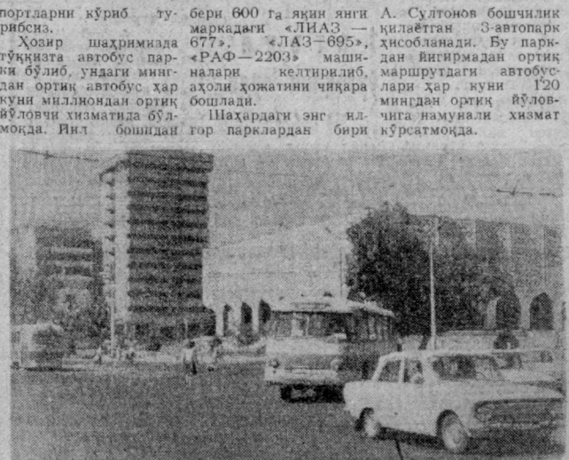
Тошкентдаги такси ҳаракати бошланди.

ОЛИС МАНЗИЛНИ ЯҚИН ҚИЛИБ... «1927 йил 23 сентябрда Тошкентда такси ҳаракати бошланди. Дастлабки кунги йиқинта такси йўлида шикди.» «1927 йил май ойида Тошкентдаги йиқинта такси автобус 62 миңга 374 кишини ташинди.» АҲОЛИ ХИЗМАТИДА Бугунги кунда учининчи такси машиналари йўловчилар хизматини берилади. Ҳар кун 250 та такси машинаси шаҳримиз аҳолиси ва меҳмонларининг 30—90—01 телефони орқали бериладиган буюртмаларини баришиб, уларнинг ҳожатини чиқарилади. Бундан ташқари 190 та такси машинаси етлаббача тавжум бўлган Аэропорт, темир йўл вокзалида нибатан кўпчилиги билан ташинишга эгадир. Ҳозир республикаимиз пойтахтида 118 та замонавий, барча қулайликлар мавжуд бўлган дорихоналар аҳолига хизмат кўрсатади. Фақат ўзини беш йилликнинг ўида 18 та янги дорихоналар ҳамшаҳарларимиз хизматига топширилди. Илгари охиригача яна бешта дорихона фойдаланишга топширилди. Булар билан шаҳримиздаги дорихоналар сон 123 тага етди. Бир йилда ана шу дорихоналар аҳолига 13,5 миллион сўмлик хизмат кўрсатади. Яна 14 та дорихонада сириваналар бўлими мавжуд бўлиб, улар аҳолига зарур бўлган доридармонларни ўз вақтида топиб беришга ердан бермоқда. Бугунги кунда йиқинтадан ортиқ дорихоналар кишиларимиз саломатлигини йўлга ҳамхўрлик кўрсатишмоқда.