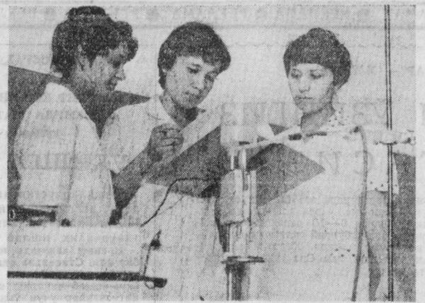
Урта Осие вази-овнат сановати лойиҳа-конструкторини илмий текшириш институтининг коллективи республикамизнинг сановат объектларини ривожлантиришга катта ҳисса қўшмоқда. Ҳозир бу ерда об-нонларни сановат миқёсида ишлаб чиқаришни нўллатириш ва унинг сифатини яхшилаш борасида биологик ва минералогик жараянларни ўрганиш, шунингдек, уни шохлаб чиқаришда қўллаш бўйича тадқиқот ишлари ҳам олиб бориляпти.

Халқлар дўстлиги майдонидagi кино-концерт залининг курувчилари ян-янг креслоларга ўтиришар экан, ҳазиллаш «билетин» гизда кўрсатилган жойга ўтиринг! дердилар. Аммо ҳеч кимда билет йўқ эди. Энди... томоша залдаги креслоларнинг паст-баландлиги ўнлаб кўрилатганди. «Томошабинлар» «партер» ҳам, «галерея» ҳам залда яхши ўрнашганлигига қаноат ҳосил қилгач, залдан қишқирлар ва мебелни йиғиштириб олдилар. Катта куришлиш симфонияси янги бир кўч билан янгради. Иш аб турган механизмлар гуволашида, электр сарка штирларнинг, монтаж асбобларнинг тақиллашда бирон ҳам дерижар қайси «партия» етакчи эканлигини аниқ-