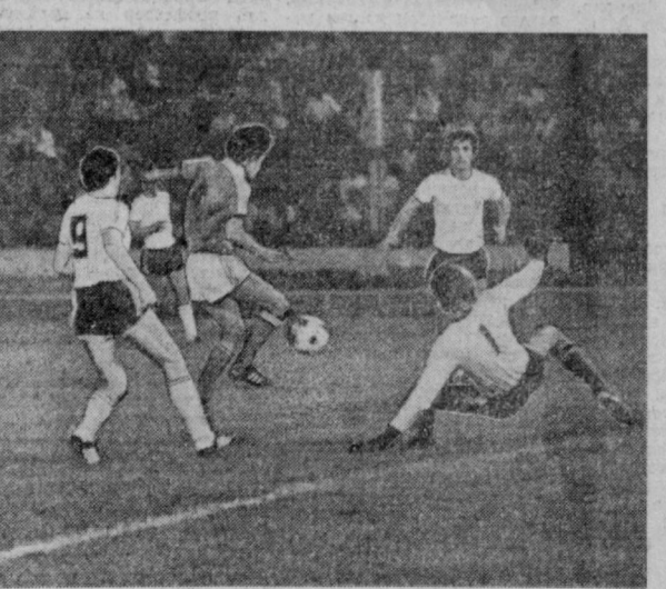
СУРАТЛАРДА: «Пахтакор» — «Динамо» ўрашувидан лавҳалар.