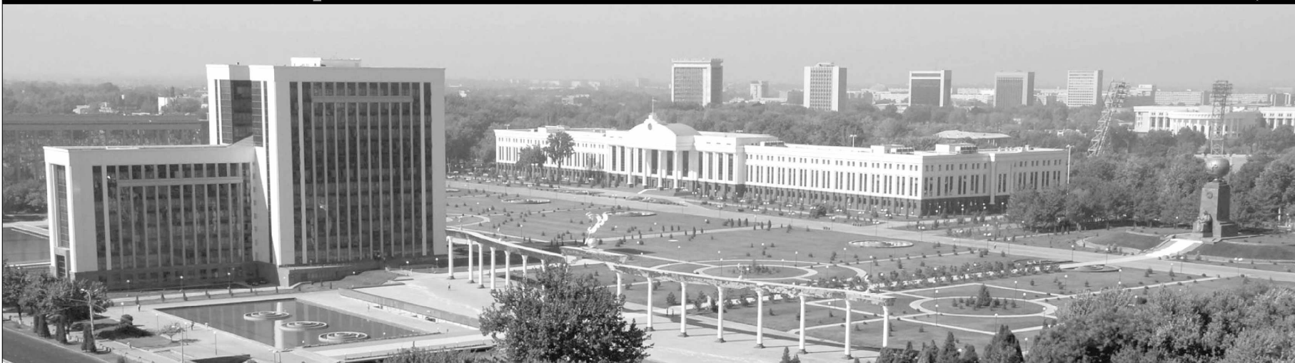
Президентимиз истиқлолнинг дастлабки кунларида: «Миллий ғурур, миллий ифтихор туйеуларини одамлар қалбига синедиришнинг янгича йўли ва усулларини, тарғибот механизмини топиш лозим», деган эди. Бунда асос бор. Чунки, мустақиллик туйфайли кўлга киритилган ютуқларни билиш озодликни қадрлашни ўргатади, эртанги кунга бўлган ишончни янада мустақамлайди.