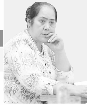
Мастура САЙФИДИНОВА, Олий Мажлис Қонунчилик палатаси депутати, ЎзХДП фракцияси аъзоси:

Зеро, Конституциямизнинг айрим моддаларига киритилган ўзгартиш ва қўшимчалар Ўзбекистон ХДПнинг Сайловдаги дастурида белгиланган вазифаларни тўлиқ амалга ошириш учун янада кенг имконият яратмоқда. Зиммасиздаги масъулиятни англаш ва берилаётган ваколатлардан қай даражада фойдаланиш партиямизнинг ҳар бир аъзоси, ҳар бир фаоли хамда депутатининг ҳаракати ва салоҳиятига боғлиқ.