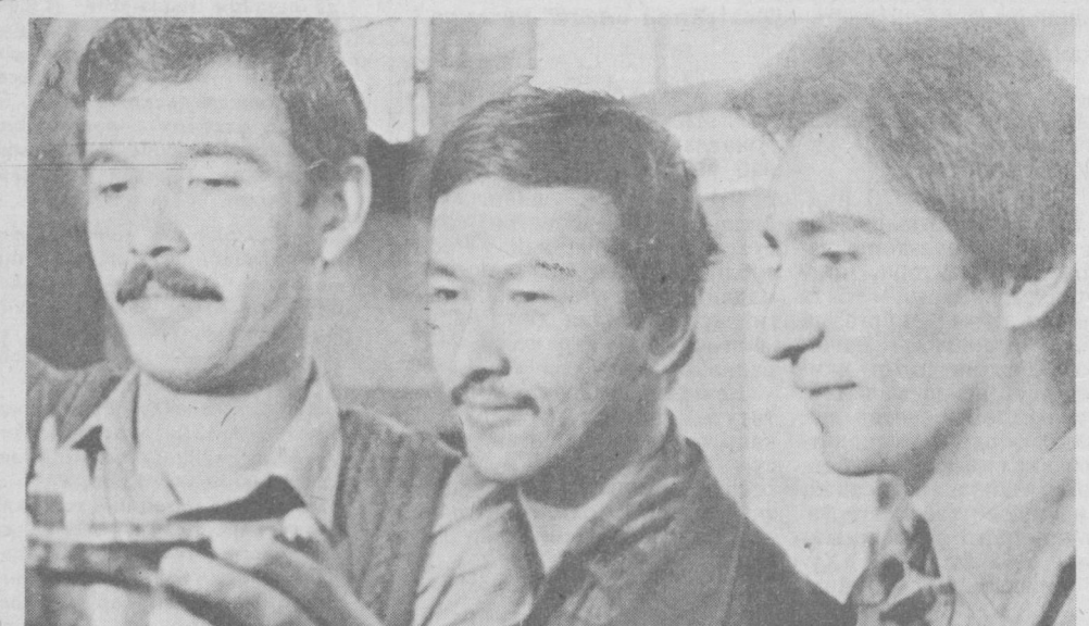
«Геологоразведка» тажриба-механика заводида ёшлар кўпчилигини ташкил этишди. Шу босқичдан қўра улғайишда социалистик мусобақа кенг йўлга қўйилган.

Мен шаҳар уруш ва меҳнат ветеранлари Совети қошидаги ёш авлодин тарбиялаш комиссиясининг аъзосиман.