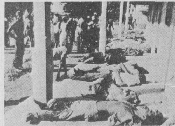
АҚШ ВА ЖАРНИНГ УНИТА каллақесарларига ҳарбий ва маъдний ёрдами Анголадagi вазиятни тобора кескинлаштирапти...