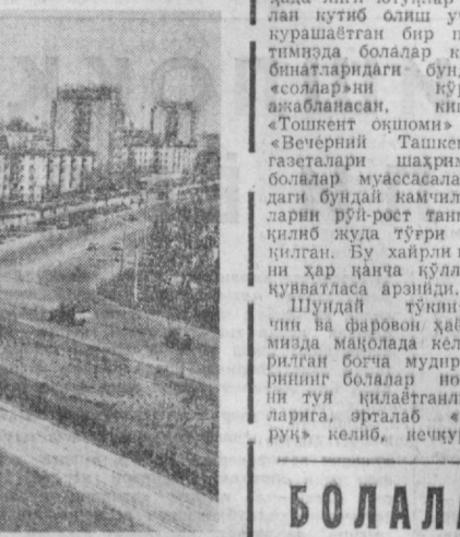
СУРАТДА: шаҳримиз ҳуенга-хуен қўшаётган М. Горький проспекти манзараси тасвирланган.