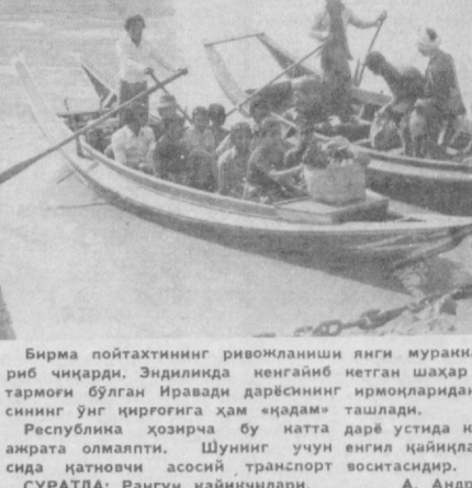
Бирма пойтахтининг ривожланиши янги мураккаб масалаларни келтириб чиқарди. Эндиликда тармоқ бўлган Ирвадди дарёсининг имконидан бери Рангун дарёсининг ўнг қирғоғига ҳам «қандам» ташлади.