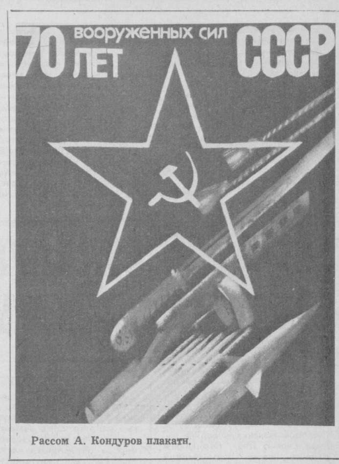
Рассом А. Кондров плакати.