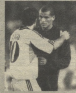
Машҳур бразилиялик футбол юдузи "Милан" клубидан озод этилгани.

дан сўнг, уни бир неча жамоалар ўз сафига қақира бошлашган эди. Ниҳоят, киши трансфер бозорида бу масалага чек қўйилди. "Спартак" (Россия), "Порту" (Португалия), "Эспаниол" (Испания) ва "Ал-Иттиҳод" (Саудия Арабистони) жамоалари таклифини рад этган Ривалдо ўз ватанига қайтди. У Бразилия миллий чемпионати грандларидан бири "Крузейро" билан шартнома имзолади.