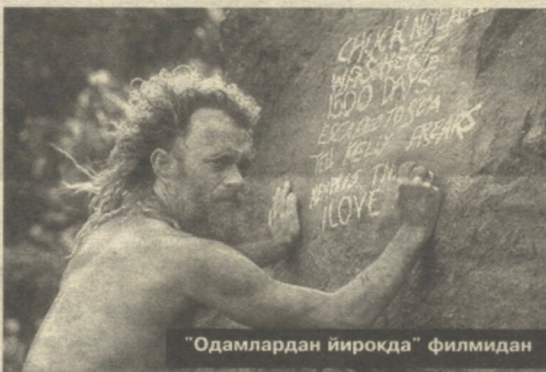
"Одамлардан йироқда" филмидан

ни яратди. Гампнинг гўллик акс этган юзига қарашингиз кифоя