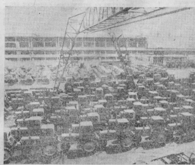
Тошкент трактор заводида ўқувчи талабаларнинг таъинланган пленуми қарорларини фанининг ишлаб чиқариш билан алоқасини таъминлашнинг талабларини ҳисобга олган ҳолда, ўзбекистон тракторсозлигининг тўғри бўлган Тошкент трактор заводи Улуг Ватан урушининг оғир йилларида барпо этилиб, урушдан кейинги беш йиллар давомида ривожланиш йўлига кириб олди.

Тошкент трактор-созлари Ўзбекистон Компартияси Марказий Комитетининг янгида ўз ишчи таъинланган пленуми қарорларини фанининг ишлаб чиқариш билан алоқасини таъминлашнинг талабларини ҳисобга олган ҳолда, ўзбекистон тракторсозлигининг тўғри бўлган Тошкент трактор заводи Улуг Ватан урушининг оғир йилларида барпо этилиб, урушдан кейинги беш йиллар давомида ривожланиш йўлига кириб олди. Бу йил биз ана шу корхонанинг 40 йиллигини нишонлаймиз. Бу давр мобайнида завод оддий сабзавот қириқдан асбоб ишлаб чиқаришдан ҳозирги Т 28Х4М ва МТЗ—80х каби мураккаб замонавий техникалар ишлаб чиқаришга бўлган катта мураккаб йўлни босиб ўтди.