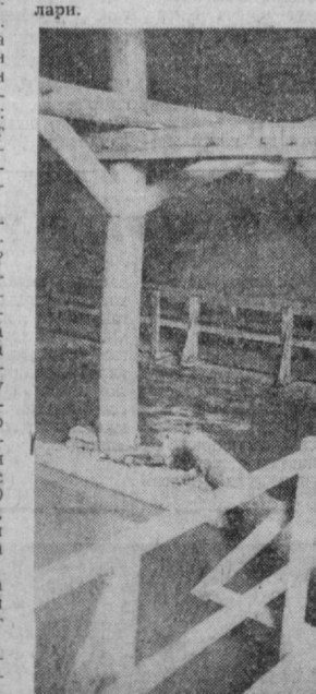
ФОТОАЙНОМА Қозғоқ фабрикасидаги тозалаш ишхоналари мана шундай аҳволда.

Р. ФАЙЗУЛЛАЕВ, М. САВЕЛЬЕВ, «Тошкент оқшони» ва «Вечерний Ташкент» газеталари мухбирлари.