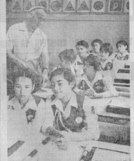
Чилонзордаги 179-ўрта мактабда бир неча йиллардан бери ўқувчилар ўртасида...