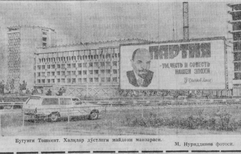
Бутунги Тошкент. Халқлар дўстлиги майдони манзараси.