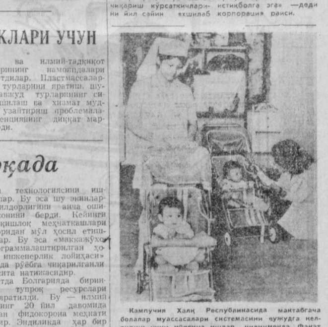
Кампучия Халқ Республикасида манбагча болалар муассасалари системасини янгида келтириш учун кўпгина ишлар қилинмоқда. Фахрат Понмепенинг ўзидангина 10 та болалар болғачлари, уялаб асқилар очилди, кўпгина вилоятларида болалар болғачлари ишлаб турибди. Ушундан ташқари, «Ўзбекистон матбуоти» дағал библиографик янги курсаткичи нашрдан чиқарди.