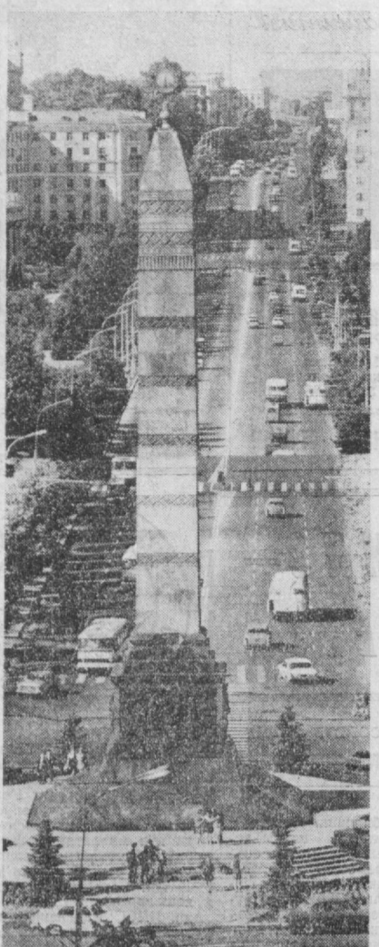
Белоруссия ССР пойтахти — қаҳрамон-шаҳар Минск. СУРАТДА: Галаба майдонда.

Халқ иқлинадиган ақойиб ишлар кўп. Биз белоруслар қардош совет халқларининг метини бирлигига мансуб эканлигимиз билан бахтиёримиз. Куч ва ишончи шу бирликдан оламиз. Шунинг учун ҳам Беларуссия ССР гимнида: Тоғабд эркин кишилар бўлиб Бахтиёр, эркин диёрда яшайми! дейлади.