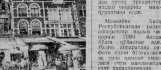
Бригоде (суратда) — Бельгиянинг қадимий шаҳридан, Фарбий Фландриянинг маъмурий марказидан, У ўзининг ўрта асп қиёфасини сақлаб қолган. Бригодедаги архитектура ёд горниқлари йўнқилик туристларнинг эътиборини ўзига жалб этмоқда.