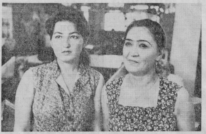
Пойтахтимиздаги кўплаб корхоналар қатори бадини буюмлар фабрикасининг жонивул коллективи ҳам СССР 60 йиллигини муносиб тўхталар билан кутиб олиш учун социалистик мусобақани тобора авж олдиришмоқда.

Уй-жой бузилаётган ишчилар учун яна бир афзаллик яратилган. Уйнинг эгаси ўз хоҳишига кўра ижрокомитетнинг ердами билан уй-жой қурилиш кооперативига аъзо бўлиши ҳам мумкин. Бироқ баён қилинган қондалар, ўзбошимчилик билан иморат қурган пайваси уйлари нисбатан қўлланмайди. Шундай экан, унингиз планли бўлса, сиз ҳам ана шу қўлайликлардан фойдаланишигиз мумкин.