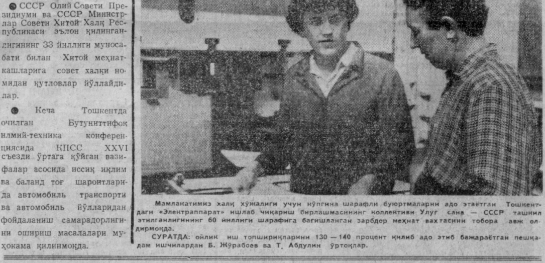
Мамлакатимиз халқ ҳўжаллиги учун йўлгина шарофли бурятмаларни адо этатган Тошкентдаги «Электраппарат» ишлаб чиқариш бирлашмасининг коллективи Улуғ сана — СССР ташкил этилганлигининг 60 йиллиги шарафига бағишланган зарбдор меҳнат вахтасини тобора авж олдирамоқда.

«Правда Востока» саҳифаларида Совет Ўзбекистони Коммунистик партияси ва ҳукумати арбобларининг доғлат ва нутқлари, мақолалари босилиб турди. Газетасида Россия, Украина, Белоруссия, бошқа қардош республикалар танили адбларининг асарлари совиб чиқарилган. Газетанинг ёриш публицистик материаллари республиканиннг порлоқ келажак сари бораётган улкан олимлари тўғрисида ҳикоя қилди ва ҳамон ҳикоя қилиб келмоқда. Ҳақлар дўстлиги гоёларини, коммунистик иде