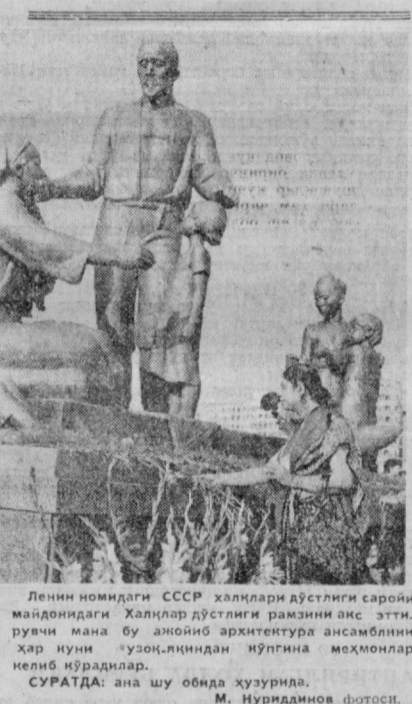
Ленин номидаги СССР халқлари дўстлиги саройи маъдонидида Халқлар дўстлиги раъзини оқ этти, ривчи мана бу аъбой архитектура ансамблининг ҳар иуни «узун»-қиндан қўлғина мехмонлар келиб кўридилар.

Эндоскоп схемаси унча мураккаб эмас: объективни бўлган ички бир қаллак, тасвирни ташқарига чиқарувчи световод қисми, окулардан иборат ҳолюс, — дейди Валерий Бурцев. — Унга ортинг ҳеч нарсани қўшиб бўлмайдигандек туюлади. Лекин биз каллакни бир эмас, салги бир-бирига нисбатан бағина бурчак ҳосил қилиб жойлаштирилган ички объектив билан таъминлашни тақлиф этдик. Ички қават световод тортиб юрмаслик учун тасвирни кинода-