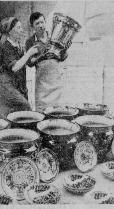
Тошкент керамика заводига СССР нинг 60 йиллик юбилеи йилида кенг истеъмол бўюлмади.

Коллектив меҳнат унумдорлигини ошириш, маҳсулот сифатини яхшилаш, уларнинг хиллини кўпайтиришга алоҳида эътибор берилмоқда. Бу ерда тайерланаётган хилма-хил сопол ланглар, носалар, пилелалар, гулдонлар, ваалага аҳоли ўртасида эҳтиёж тобора ортиб борапти. Шу йилнинг ўзига корхона коллективини ундан ортиқ янги буюмини ишлаб чиқаришни ўзлаштириди.