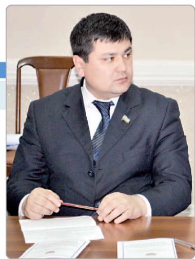
Улуғбек ЗОКИРОВ, Олий Мажлис Қонунчилик палатаси депутати, ЎзХДП фракцияси аъзоси.