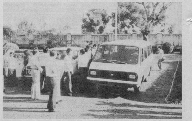
Совет Иттифоқи ёш Кампучия республикасида социализм асослари қуришда муттақил ёрдам кўрсатиб келмоқда...