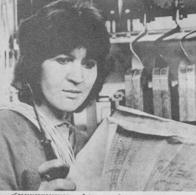
«Средэлектрораппарат» бирлаш маск бош қорхонасининг катта коллективи 1984 йил ҳисобига меҳнат қила бошлади. Бу коллектив юксак унвотдорлик билан ишлаб, фақат Сифат белгиси билан маҳсулот ишлаб чиқаришга қарор қилган.

КЎМИЛГАН АРИҚ Янгибод массивидаги кўчаниннинг исми жинсига монанд — Муссаффо, деб аталади. Унинг муссаффолигини янги илҳоллар таъ-минлайди. Лекин, икки йилдан, шу кўча-даги 40-уйдан то 60-уйгача бўлган арқада сув оқмайди. Бунинг оқибатида дараклар курий бошлади. Ариқча сув чиқаришининг икки йўли бор. Бирини шу атрафдан ўтвчи каналдан сув чи-қариш мумкин бўлса, иккинчиси қўмиллиб кетган эски сув йўлини очибди. Бунага аҳо-лининг кучи етмайпти. Ҳамза районга обон-лаштириш бошқармасиданлар эса бепарво юришибди. Бу аҳвол қачонгача давом этади? Ҳ. ХОТАМБОВА, З. СОЛИЕВА ва бош-қалар.