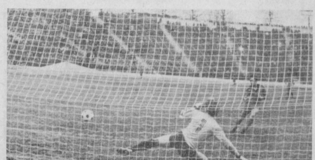
Учрашувлардан лавҳалар.

ки гурупада ўтказилди. Бу йилги мавсумда командаларни комплентлашга жиддий ёрдошимоқда. Барча мастерлар командалари энди ўларни тайёрлаган футболчиларга дан ошмаган футболчиларга берилди. Мавсум давомида бир лига командаларининг ўйинчи алмаштириши бутунлай тақиқланган. Фақат СССР Қўроли Кўчлари командаларида қатна-