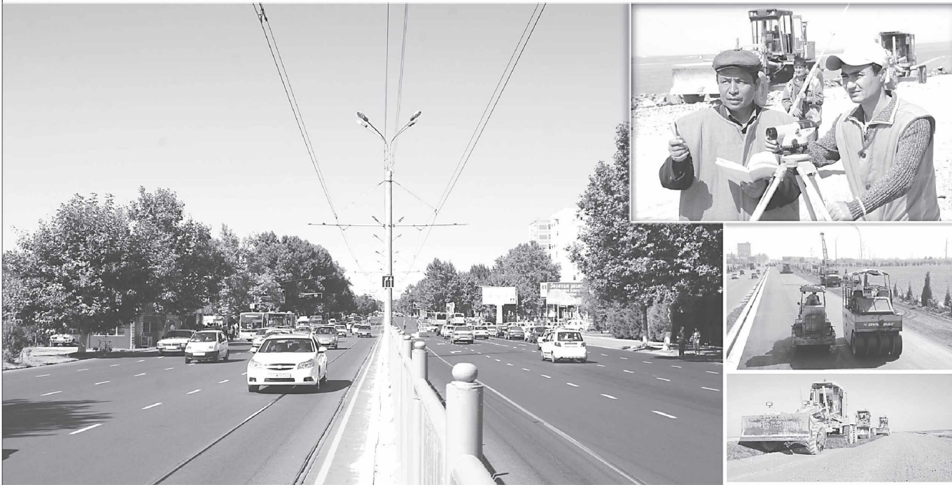
(Давоми. Боши ўтган сонда.)