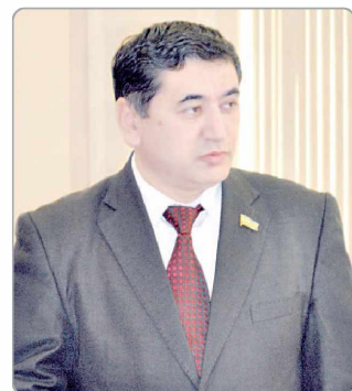
Фахрииддин РАЖАБОВ, Олий Мажлис Қонунчилик палатаси депутати, ЎзХДП фракцияси аъзоси.

Турнирнинг махсус предметни қўл ва оёқ зарбаларида синдириш баҳсида аънавий қаратэ устаси Азиз Ражабов голиб бўлди. Махсус предметни сакраган ҳолда зарба билан синдиришда халқидо устаси Дмитрий Ким ва ўзбек жанг санъати вакиласи Ситора Нишоновга тенг келадигани топилмади.