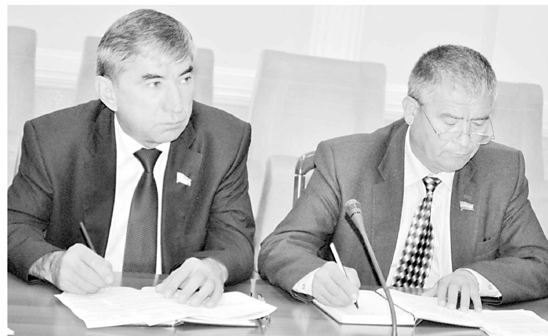
Фракция «Ўзбекистон Республикасининг айрим қонун ҳужжатларига ўзгаришлар киритиш тўғрисида»ги қонун лойиҳасини биринчи ўқишда муҳокама этди.

Қонун лойиҳасидан кўзланган асосий мақсад амалдаги бир қатор қонунларни «Маданий мерос объектларини муҳофаза қилиш ва улардан фойдаланиш тўғрисида», «Маданий бойликларнинг олиб чиқилиши ва олиб қилиниши тўғрисида», «Архив иши тўғри-