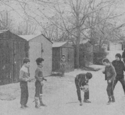
СУРАТЛАРДА: «Марказ-5» кварталдаги машиналар турадиган махсус очиқ жой (чапда) шахсий автомобиль эгаларига жуда манзур бўлмақда. Негаки, бу ерда машиналарни ишончли сақлаш учун барча шарт-шароитлар яратилган; «Марказ-13» квартал қусинга доғ тушириб турган бундай металл гаражлар (ўртада) аҳоли учун ҳам катта ноқулайлик туғдирмоқда.