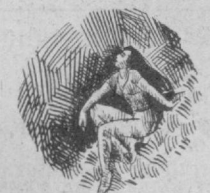
Эй басавлат муҳаббат, Менга давлат муҳаббат, Менга жаннат муҳаббат!

Мен қилмасан асло башорат, Ундайларга илҳосим ҳам йўқ. Лекин тонга қилиб ишорат, Дейман: куним ўтади ёруғ. Сизни кўрдим. Кўрмоқ ўзи бахт... Кўзларингиз олов нечоғлиқ. Дерлар: бутун кунги кайфият Тонгда кўрар кишингга боғлиқ. Келардингиз кўшга монанд. Не иштиёк, не тугён бўлиб, Ёруғликка, шавққа банду банд, Зулумотга беомон бўлиб, Кўрдим сизни.