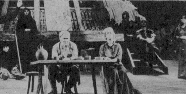
СУРАТДА: спетанландан бир кўриниш.