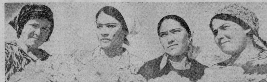
Пойтахт областининг Оқдўғрон райони пахтакорлари ҳам терим суръатига-суръат қўшишга интилоқдалар. Районнинг «Лейнобод» колхозиде бор маконийлардан тўла-тукис фойдаланилганди. Сиз бу суратде кўпнинг кил로그램чилар ҳаракатининг пешқадамларини кўриб турибсиз.

Х. ИКРОМОВ, А. ЭГАМНАЗАРОВ, «Тошкент оқшомини» махсус мухбирлари. (Давоми бор).