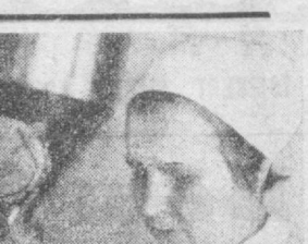
СУРАТДА: В. Панферовнинг номи хурмат билан тилга олиниди...