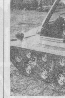
Польша Халқ Республикасининг Радомиш заводалардан бирининг инженерлари сув, қалин қор қатламлари ҳамда ботиқонли жойларда юра олунчи вездеход машинани ишлатди.

Бу машина дастлаби синовлардан муваффақият билан ўтди. Машина «Фнат-126Р» енгил автомашинасининг дигатели ва бир қанча қисмлари асосида ташкил топди. Янги кунларда бу минти вездеход кўлаб ишлаб чиқарила бошланди.