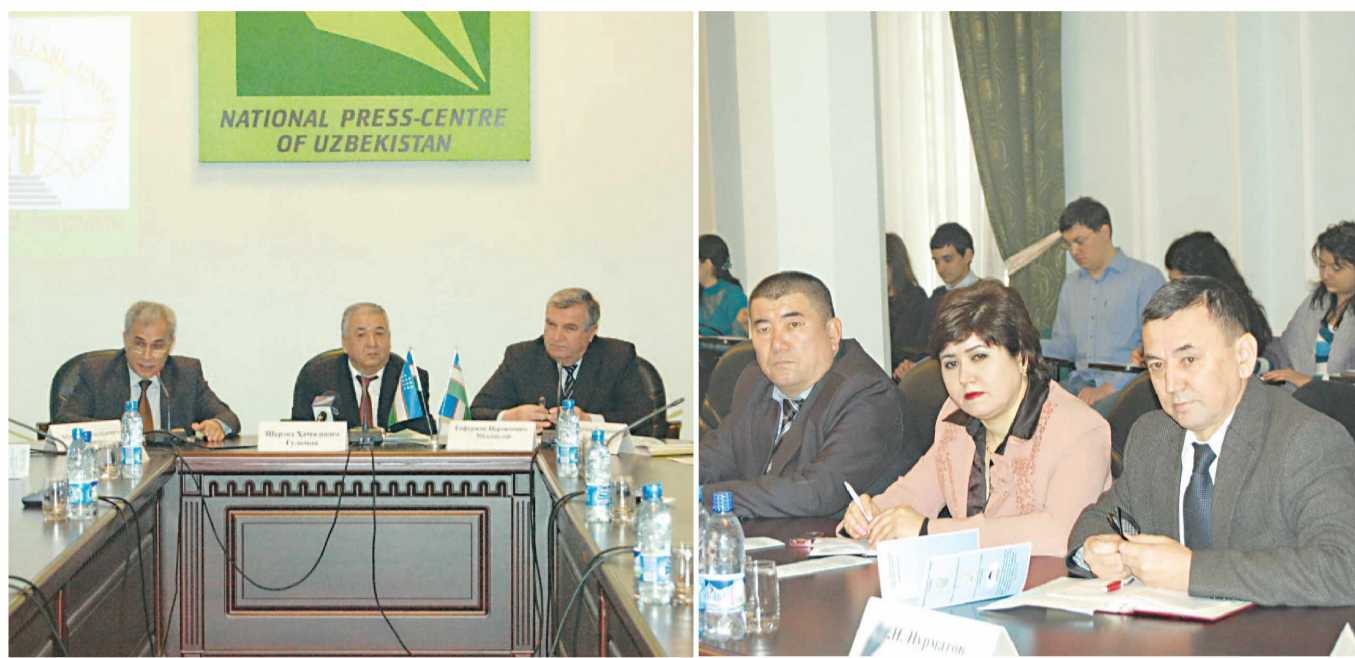
Матбуот анжуманида ўқувчилар ва ўқитувчиларнинг муносабати билан журналистларнинг тайёрлаш ва қайта тайёрлаш борасидаги устувор вазифалар, тажриба ва амалиёт мавзусида матбуот анжумани ўтказилди.

Ўзбекистон журналистлари ижодий уюшмаси ташаббуси билан Мирзо Улуғбек номидаги Ўзбекистон Миллий университети ва Ўзбекистон давлат жаҳон тиллари университети ҳамкорлигида «Журналистика соҳасида кадрлар тайёрлаш ва қайта тайёрлаш борасидаги устувор вазифалар, тажриба ва амалиёт» мавзусида матбуот анжумани ўтказилди.