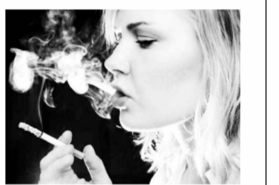
Киб ёки спиртли ичимлик истеъмол қилиб, ўз зуррияти соғлимига қатта зиён етказиши аник.

Янги қонун лойиҳасига қўра, ҳўмилидор аёл ёки вояга етмаган ўсимир жомаот жойида сигарет чекиб қўлга тушса, унга нисбатан 51 дан 85 гривенгача миқдорда жарима жазоси қўлланади. Спиртли ичимлик истеъмол қилган шахслар ҳам бундан мустасно эмас. Агар иккинчи бор шу айбон билан ушланса, жарима миқдори ортади, яъни 170 гривен тўлашага мажбур қилинади. 16 ёшгача бўлган ўсимирларнинг бу «қилик»лари учун ота-онаси жавобгар бўлади — жарима ни уллар тўлайдилар.