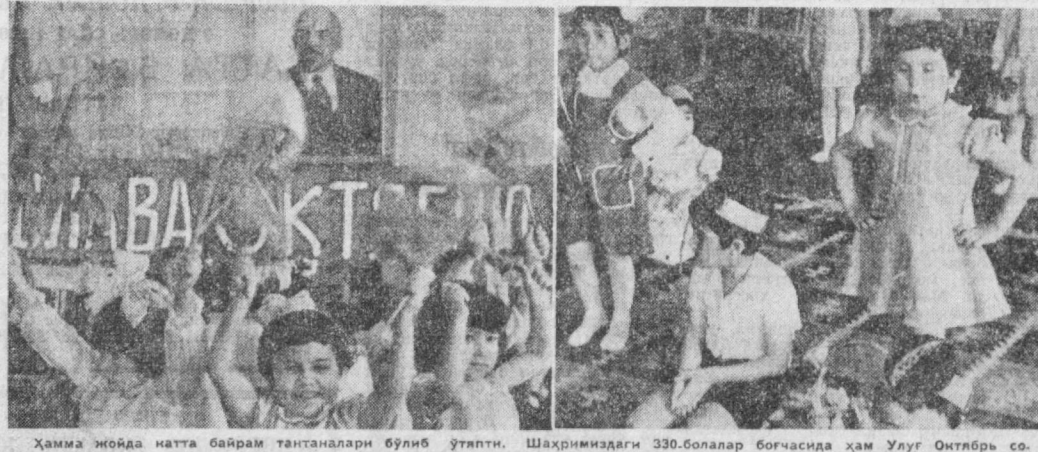
Хамма жойда натта байрам тантаналари бўлиб ўтпти. Шаҳримиздаги 330-болалар богчасида ҳам Улуғ Октябрь со.циалистик революциясининг 63 йиллигига бағишланган эртанги жуда шодона олиб берилди.

олам кўзида қалқиган изтироб ёшларини арди. Унинг кўлга олиб, эртанги орауларига қанот бағишлади. Туни билан фарзандлик ҳисси-ла тўлган чиндик.