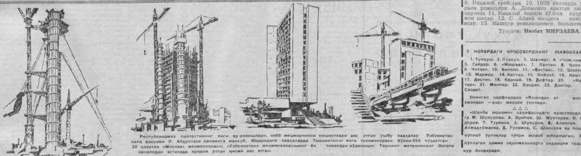
Республикамиз пойтахтининг янги қурилышлари, ноб мезмориликни нишоотлари аниқ этган ушбу лавҳалар Узбекистон халқ рессони Л. Абдуллаев қаламига мансуб. Юқоридagi лавҳаларда Тошкентнинг янги телеинораси, Кўнжа буй чўзаётган 20 қаватли «Москва» меҳмонхонаси; «Узбекистон» меҳмонхонасининг ён томондан кўриниши; Тошкент метросининг Олтепа мандалидан астанда орданли ўтган қисми аниқ этган.