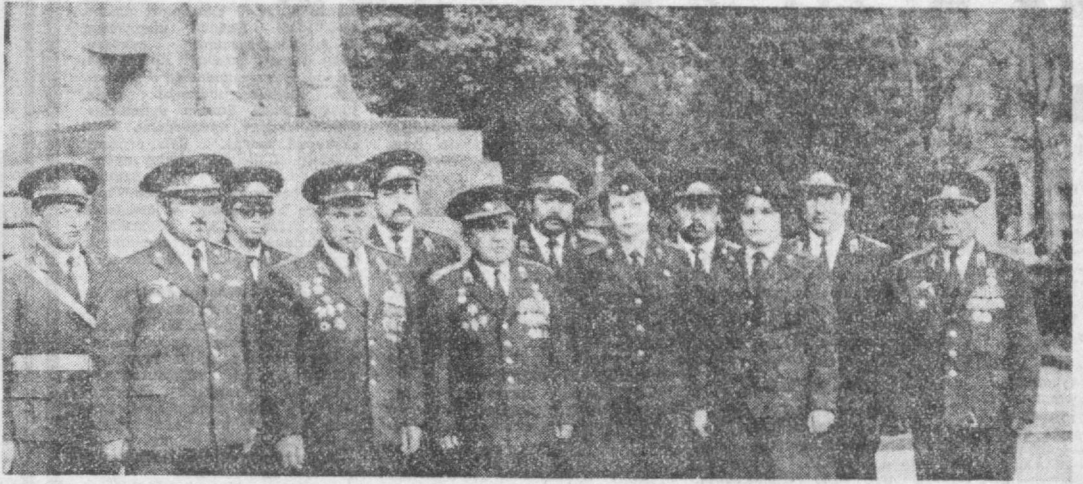
Шаҳар милицияси ходимлари ҳар қандай об-ҳаво шароитида туну кун уларнинг машаққатли хизматларини давом эттиришлари. Ушбу тартиб-интибори муҳофазаси қилиш олдига СССР Конституциясида аниқ кўрсатилган талаблар қилиб қўйилди.

Совет милициясининг бутун тарихи — бу, халққа, жонажон Коммунистик партияга сийқилган, саноқат билан хизмат қилиш тарихидир. Экономикани ривожлантириш, ички муносабатларни такомиллаштириш, совет демократиясини ривожлантириш, оммавий меҳнат ва сиёсий активликни ошган ҳолатда бир пайтда совет милицияси олди.