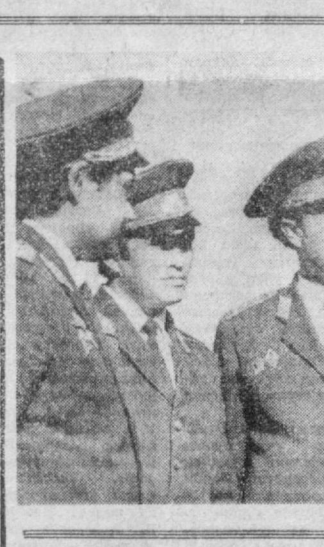
Редакция почтасидан «Марҳамат, ташаккур билдирсангиз...»