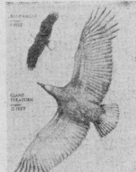
СУРАТДА: топиладиган кyшнинг тахминий қиёфаси. Юртинроқда тақрибан 2,5 метрга тенг бўлган бургутнинг сурати берилган.