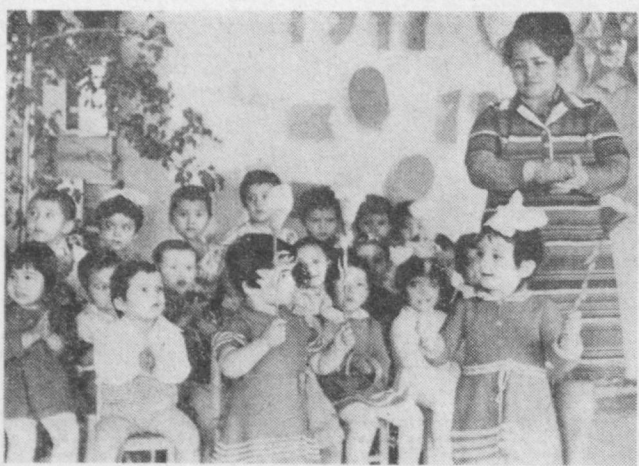
Фарзандларимиз бахтиёр, улар учун иккинчи уйлари—боғчаларда ҳамма шаронлар яратиб берилган...