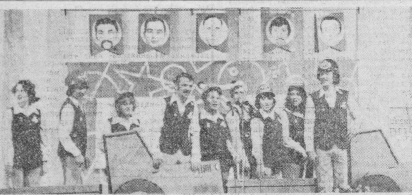
СССР 50 йиллиги номидаги Тошкент трактор заводининг маданият саройи агитколлективининг репертуари раиғ-баранг ва маъмулликлар. Транкторозлар агитколлективининг олиб бораётган иши мактабга сазовор бўлмоқда.

18.15 Кўрсатувлар программа-си. 18.20 «Янги» кўрсатув (так-рорий). 19.00 «Ешлик» студияси кўрсатади.