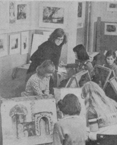
Шаҳримиздаги поёфзалчилар маданият саройида бир неча йилдан бери ҳаваскор рассомлар студияси ишлаб келмоқда. Студияга турли касбдаги ишчи ва хизматчилар, студент ва ўқувчи ёшлар қатнашадилар. СУРАТДА: студия қатнашчилари навбатдаги машғулотда.

ликлинкаларига бир-икта профессорлар ва доцентлар рўйхатини тасдиқлади. Врачлар малакасини ошириш институтида консултация-диагностика ишлари медалларни ўқитиш, уларнинг