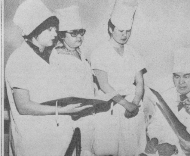
Тошкент қурилиш беш бошқармасига қарашли медицина-санитария касалхонасининг урология бўлими коллективидан кўплаб беморлар мамнун. Бу бежиз эмас, албатта. Улар бу ерда дардан фойда бўлиб, тамомилан соғайиб чиқмоқдалар.