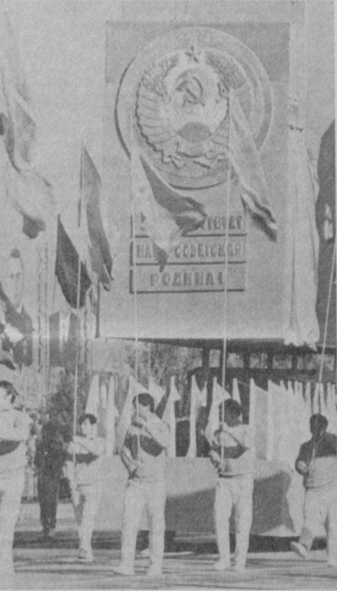
ТОШКЕНТ. 1983 ЙИЛ 1 МАЙ. В. И. Ленин номи майдонда шаҳар меҳнаткашлари вакилларининг намоийши ва спорт байрами.