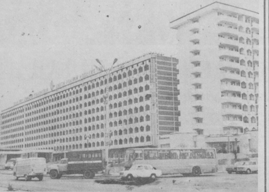
Бугун шахримиз кўчалари янада файзли, янада кўркам. Хўбон ва боғлар одамлар билан гавжум. Мухташам бинолар ўз салобати билан шахримиз ҳўсига янада ҳўси кўшиб турибди. СУРАТДА: янги Ўзбекистон кўчасининг бугунги кўриниши.

Ю. МАХМУДЖОНОВ, республика «Госкомсельхозтехника»-сига қарашли Меҳнат Қизил Байроқ ордени тахрир-ремонти механизаводи деталларини тиклаш цехининг тоқари, СССР Давлат мукофоти лауреати.