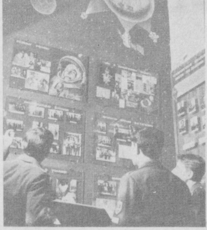
Оренбургдаги учувчиларнинг Олий ҳарбий авиация билан юрти 130 дан ортқ Совет Иттифоқи Қўрғонларини еттириб берди. Улар орасида планетамизнинг биринчи космонавти Ю. А. Гагарин ҳам бор.

Ҳа, қатта қувван ҳофиза соҳиб Лазиз Азизода худди шу санада Ташкент шаҳрида таваллуд топди. Болаликдан турк, рус, форс-тожик ва араб тилларини қўнч билан ўрганди. Улуғ Октябрь соҳилсинг революцияси қадар мадрасада таҳсил олди. 1908 йилдан бошлаб бошланғич синфларга сабоқ берди. У 1914 йилдан тараққиётлар ҳаракатларида янги услубдаги мактабларни ташкил қилишда, газета ва журналларни нашр эттиришда «Турон» адабий жамиятининг фаол аъзоси сифатида қўнчи. Ўрта Осиё халқларининг чоризмга қарши беш кўнчарини вақтда (1916) Ташкент кўнчаларида қўнчи ташкил қилди ва Низомиддин Ўлжаев уйда бўлиб турадиган яшар маклисларида иштирок этди.