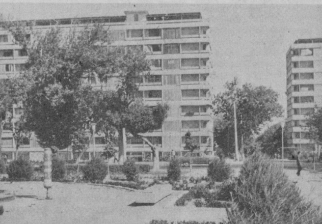
Шу кунларда шаҳримиз ўзининг 2000 йиллик юбилейини муносиб кутиб олиш учун қизғин тайёргарлик кўрмоқда. Жойларда ободонлаштириш борасида талай ишлар амалга оширилмоқда. Шаҳримизнинг Ленин кўчаси ҳам кун сайин чирой ояпти. СУРАТДА: мазкур кўчанинг кундан-кунга обод бўлиб бораётган турар жой бинолари қисми.

— Мақтуб автори Раҳимжоновнинг эътироси мутлақо тўғри. Ҳақиқатан ҳам Радинальнa кўчасида канализация ш т и