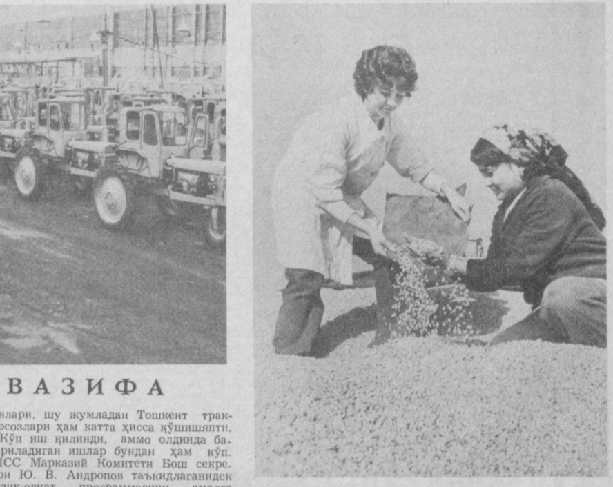
СУРАТЛАРДА: Тошкент трактор заводининг тайёр маҳсулоти; Ўзбекистон галласи.

КПСС Марказий Комитетининг май (1982 йил) Пленумида тасдиқланган Озиқ-овқат программасини амалга ошириш чоралари комплексидики қишлоқ хўжалиқларини комплекс механизациялаш воситалари, боғдорчилик катта роль ажратилган. Кейинги йилда пойтахт санатор қорхоналари: ● СССР 50 йилги номидаги Тошкент трактор заводи» ишлаб чиқариш бирлашмаси мамлакатимиздаги дехқонларга 25,5 миңга пахтали қоп-қанорсиз ташйиридан трактор принцип етказиб берди. ● «Узбексельмаш» пахта етиштирадиган республикаларга 8,9 миңдан зиёд чигит экадиган саялка, 2,656 та пахта тосалайдиган машина етказиб берди. ● «Ташсельмаш» мамлакатимиздаги пахталик хўжалиқларига 9,9 миңга турли хил пахта териш машинаси етказиб берди. Уларнинг орасида кенг қатор ва тур қатор эгатирадиган пахтали териш машиналари бор. ● «Ташхизсельмаш» қишлоққа 6,453 та чағлагич-пуриқич етказиб берди. Бу техника кейинги пайтда гўзмин дефляция қилишда кенг қўлланилмақда. Шунингдек, унинг самолет орқали дефляция қилишдан устулнинг амалда нисбатлани.