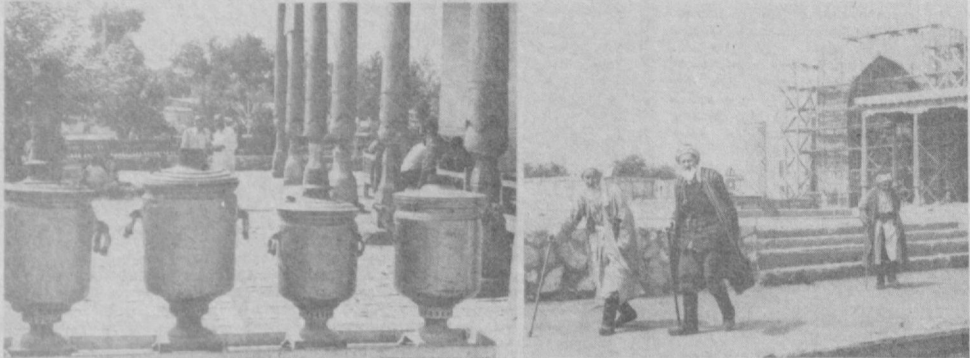
РЕСПУБЛИКАМИЗ ШАХАРЛАРИ БУЙЛАБ СУРАТЛАРДА: Бухоро манзаралари.