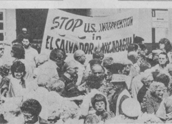
АҚШ «Сальвадор ва Никарагуа»нинг ички ишларига АҚШнинг аралашуви тўхтатилсин! — ана шу шнор остида Нью-Йоркда Америка прогрессив жамоатчилигининг оммавий намойиши бўлиб ўтди (суратда).

Ҳиндистон ҳукумати мамлакатнинг тўққизта штатида жойлашган 22 та катта шаҳарни ривожлантириш программасини бажариш учун қарий 15 миллион рупия ажратди. Программага ана шу аҳоли пунктларининг иқтисодий ва маданий марказ сифатидаги ролини ошириш вазифаси ўртага қўйилган. Маъбағлар транспорт системасини, савдо-сотиқни, сув таъминотини такомиллаштириш ва турли социал маънавиятга маданий муассасалар ишларини яхши-лашга сарфланади. Ҳиндистонни ривожлантиришнинг 1980 — 1985 йилларга мўлжалланган олтинчи беш йиллик плани давомида программда камидан юз минг аҳоли бўлган Ҳиндистондаги қарийб 200 та шаҳар қамраб олинган. Ҳиндистон демографияси программани бажариш қишлоқ аҳолисининг катта шаҳарларга кўчиб боришини камайтиришга имкон беради, деб ҳисобламоқдалар.