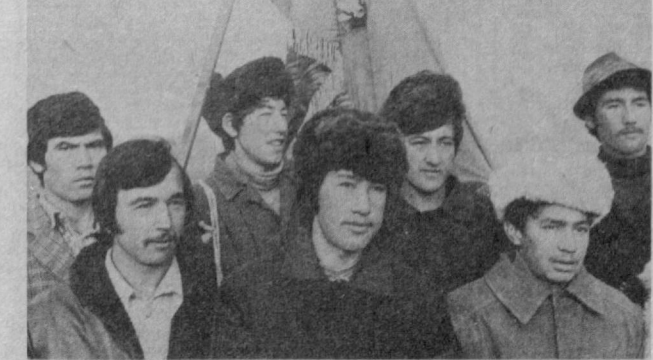
Тошкент геология-қидирув техникумининг коллетиവി Сирдарё област Оқолтин райониди илгор «Андимон» совхозиди пахта илгирчи-теримида фаол иштирок этмоқда.

Бош штабда бизга Сирдарё областиди хўжалиқларида меҳнат қилаётган ўқувчилар коллективлари ўрта сиртди муСОБАҚАДА Тошкент Давлат университети, Тошкент автомобиль йўллари институти, Тошкент ирригация ва қишлоқ хўжалиғини механизациялаш инженерлиги институти ҳамда Тошкент геология-қидирув техникуми студентлари намуна кўрсатаётганликлари ни таъйинланди.